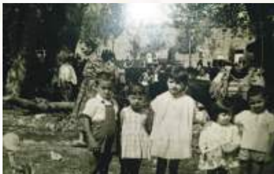
Στιγμές από τό παρελθόν (1962). Πανήγυρις τοῦ Ἁγίου Προδρόμου