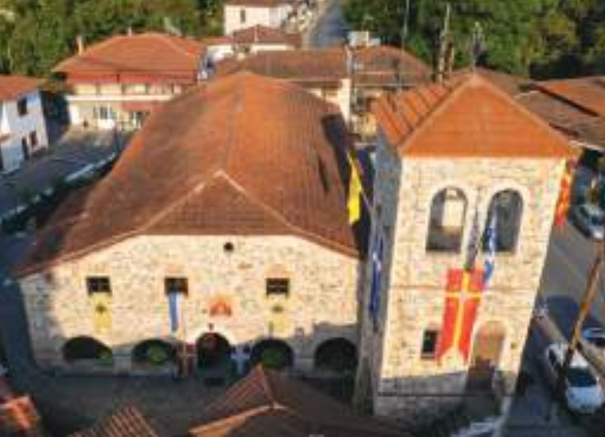
Πανοραμική άποψη του Ίερου Ναού, ώς έχει σήμερα.

μετρικά σχέδια, ενώ και η επίπεδη ξυλοπαγής οροφή διαρέϊται σε ζώνες όπου διαμορφώνονται γεωμετρικά σχέδια με χρωματικές έναλλαγές καφέ αποχρώσεων· στο κέντρο της σχηματίζεται όμφαλός όπου εικονίζεται ο Παντοκράτωρ. Το περίτεχνο ξύλινο τέμπλο του Ναού κοσμεϊται σε ζώνες με ιδιαίτερης όμορφιάς μεταβυζαντινές εικόνες γαλατσάνικης τεχνοτροπίας, από τις