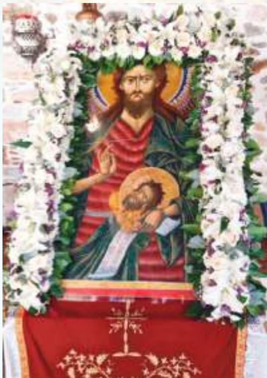
Σύγχρονη εικόνα τοῦ Τιμίου Προδρόμου Γαλατσάνικης τεχνοτροπίας.