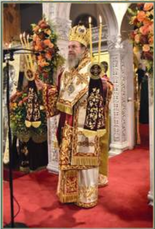
Ὁ Σεβασμιώτατος Μητροπολίτης Ἱερισσοῦ, Ἁγίου Ὄρους καὶ Ἀρδαμερίου κ.κ. ΘΕΟΚΛΗΤΟΣ