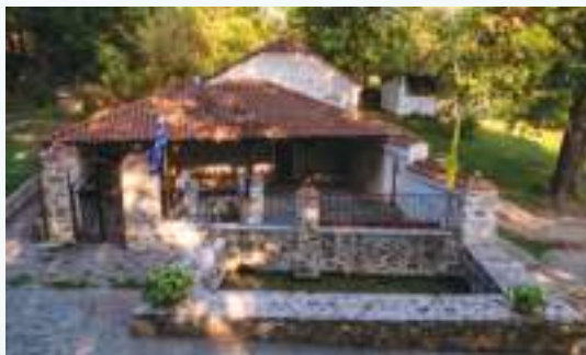
Τὸ ἐξωκκλήσιο τοῦ Τιμίου Προδρόμου ἀπὸ δυσμάς.

Τὸ ἐξωκκλήσιο σημειώνεται καὶ σὲ ὀθωμανικὰ κατάστιχα τοῦ 1872 ὅπου ἀναφέρεται ὡς Pirodromo ἢ Aya Pirodromo καὶ πανηγυρίζει στὶς 29 Αὐγούστου, ἐπὶ τῇ μνήμῃ τῆς ἀποτομῆς