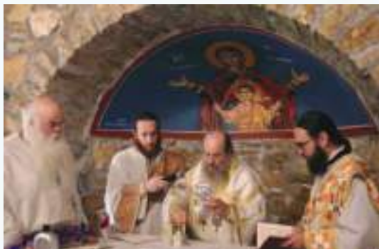
Τά Έγκαίνια τοῦ Παρεκκλησίου τῆς Ἁγίας Ἄννης.