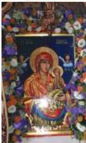
Ἡ εἰκόνα τῆς Ἁγίας Ἄννης.

τῆς Ἁγίας Ἄννης, ἀγιογραφηθεῖσα ἀπό τόν Ἱερομόναχο Θεόφιλο τῆς Ἀδελφότητος τῶν Θεοφιλαίων πού ἐγκαταβιώνουν στή Σκήτη τῆς Ἁγίας Ἄννης στό Ἅγιον Ὅρος. Οἱ ἐργασίες ἐνετάθησαν τά ἐπόμενα ἔτη ὑπό τήν ἀμέριστη συμπαράσταση τοῦ Μητροπολίτου μας κ. Θεοκλήτου, ὁ