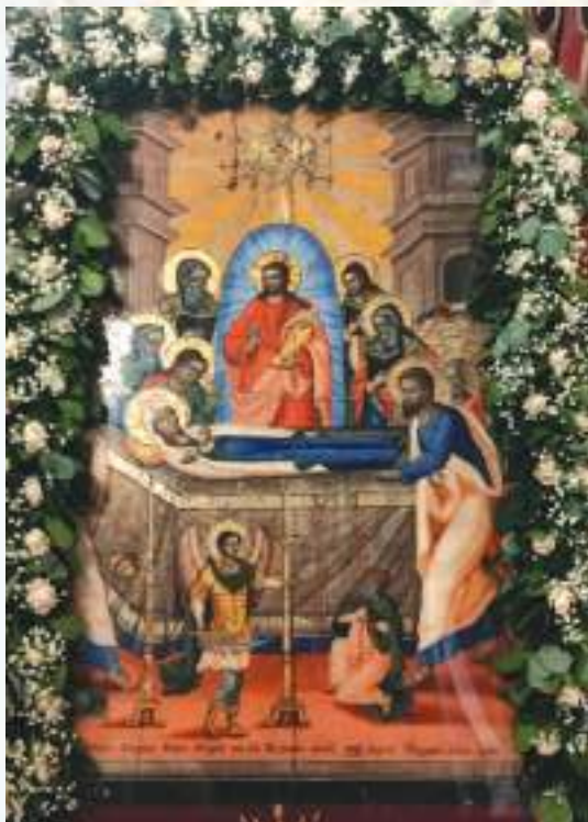
Μερική άποψη του τέμπλου του Ίερου Ναου της Κοιμήσεως της Θεοτόκου.