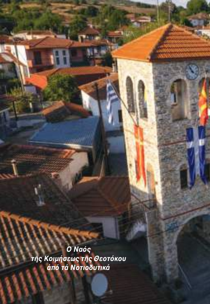
Ο Ναός της Κοιμήσεως της Θεοτόκου από τὰ Νοτιοδυτικά