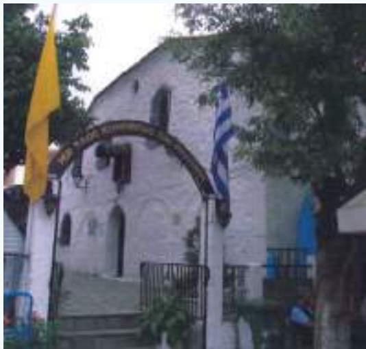
Ὁ Ἱερός Ναός τῆς Κοιμήσεως τῆς Θεοτόκου πρό τῆς ἀνακαινίσεώς του.

Ἐσωτερικῶς ὁ Ναός, πού διαθέτει χαμηλό ὑπερῶο (γυναικωνίτη), εἶναι ἐπιστρωμένος μέ περίτεχνα πλακίδια πού δημιουργοῦν γεω-