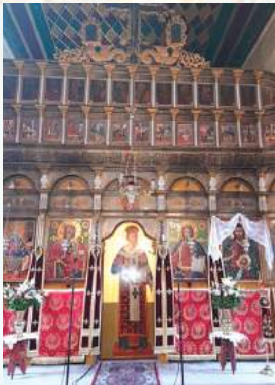
Μερική άποψη του τέμπλου του Ἱεροῦ Ναοῦ τῆς Κοιμήσεως τῆς Θεοτόκου.