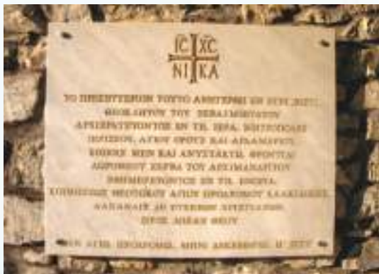
Ἡ κτιτορική ἐπιγραφή τοῦ Πρεσβυτερείου.