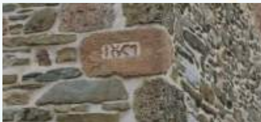
Κεραμικές ἐπιγραφές μέ τό ἔτος κτίσεως τοῦ Ναοῦ.