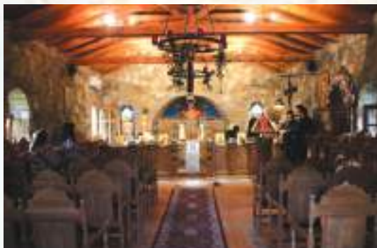
Τό έσωτερικό του παρεκκλησίου της Αγίας Άννης.