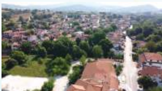
Ὁ οἰκισμὸς τοῦ Ἁγίου Προδρόμου ἀπὸ δυσμᾶς.

Ο Άγιος Πρόδρομος αποτελεί ένα μικρό, αλλά γραφικό χωριό τής όρεινης Χαλκιδικής. Κτισμένο στις βορειοδυτικές υπώρειες του Χολομώντος, συνιστά ακόμη και σήμερα σημείο αναφοράς για τους επισκέπτες τής περιοχής, τόσο για τους προσκυνητές του Άγιου Όρους, καθώς εύρίσκεται επί του όδικοῦ ἄξονος πρὸς τὸ “Περιβόλι τῆς Παναγίας”, ὅσο καὶ γιὰ ἐκείνους πού ἀποζητοῦν νὰ ἀπολαύσουν τὰ κάλλη τῆς ἑλληνικῆς φύσεως καὶ τὴν ἰδιομορφία τῆς Μακεδονικῆς γῆς.