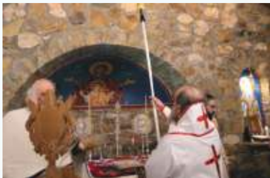
Τά Έγκαίνια τοῦ Παρεκκλησίου τῆς Ἁγίας Ἄννης.