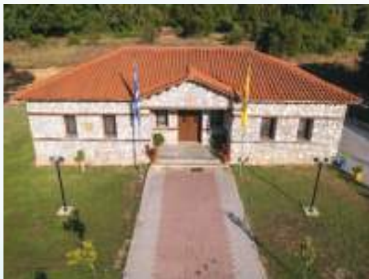
Ἐποψη τοῦ Πρεσβυτερίου.