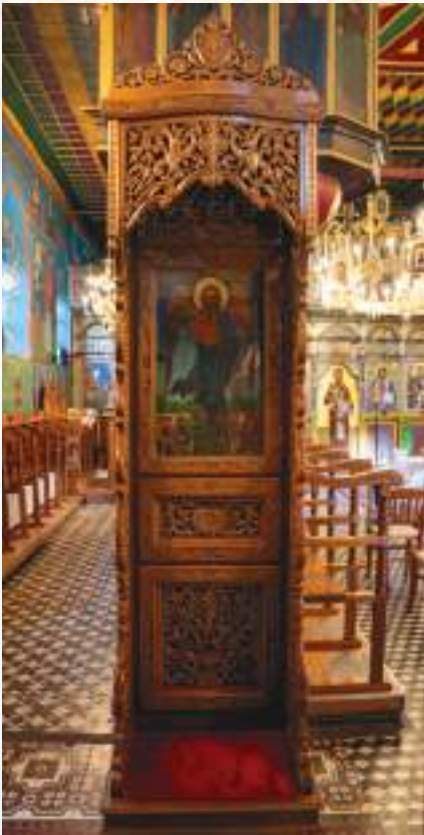
Τό νεότευκτο ξυλόγλυπτο προσκυνητάρι καί (δίπλα) ή περίπυστος εικόνα του Τιμίου Προδρόμου (18ος αί.)