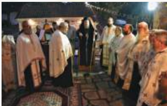
Ἀρχιερατικός Ἑσπερινός ἔξωθεν τοῦ ἔξωκκλησίου τοῦ Ἁγίου Προδρόμου.