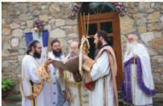
Τά Έγκαίνια τοῦ Παρεκκλησίου τῆς Ἁγίας Ἄννης.