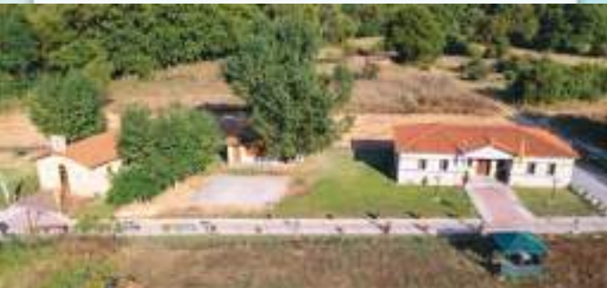
Πανοραμική άποψη του Παρεκκλησίου της Αγίας Άννης καί του παραπλησίου Πρεσβυτερείου.