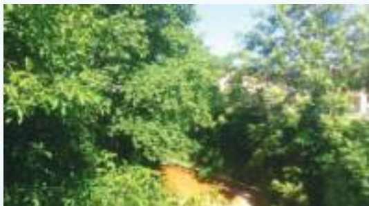
Ὁ Ρεσε(ι)τνικιώτης ποταμός.

Στήν εὐρύτερη περιοχή ἔχουν ἐπισημανθῆ ἴχνη νεολιθικῶν οἰκισμῶν, ἐνῶ περισσότερα εἶναι τά ἀρχαιολογικά κατάλοιπα τῆς κλασσικῆς καί ἑλληνιστικῆς περιόδου. Ἡ κατοίκηση τοῦ χώρου συνεχίστηκε καί στή ρωμαϊκή περίοδο, ὅπως βεβαιώνουν οἱ ρωμαϊκοί τάφοι πού ἐντοπίστηκαν στά ὄρια τῆς σημερινῆς Κοινότητος.