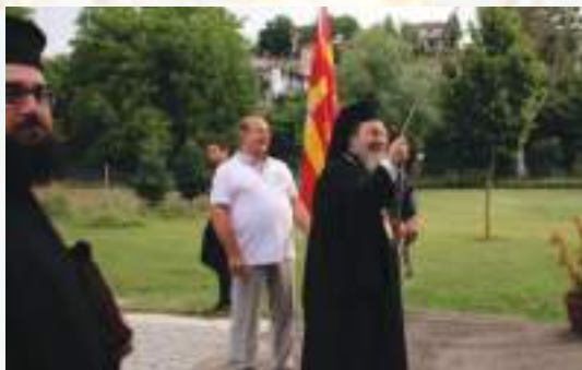
Καί ἔκρουσαν κώδωνας...