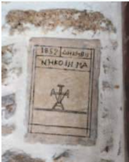
Κτιτορική ἐπιγραφή τοῦ ἐξωκκλησίου τοῦ Τιμίου Προδρόμου.

Τὸ ναῖδριο υπέστη σχεδὸν ὀλική καταστροφή ἀπὸ πυρκαϊὰ τὸ 2001, ἀλλὰ ἀπέκτησε τὴν προτεραιὰ του λάμψη καὶ ὁμορφιά χάρις στὶς ἄοκνες προσπάθειες τῶν Ἄγιοπροδρομιτῶν