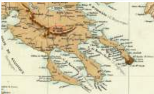
Γαλλικός χάρτης τοῦ 19ου αἰ. ὅπου σημειώνεται τό χωριό Réchiténikia .

Σαφές τεκμήριο υπάρξεως οίκισμοῦ στήν εὐρύτερη περιοχή τοῦ Ἁγίου Προδρόμου ἀποτελοῦν βυζαντινά χειρόγραφα ἀπό τόν 9 ο καί 10 ο αἰ. μ.Χ.. Συγκεκριμένως, σέ χειρόγραφο τῆς Μονῆς Ἰβήρων, χρονολογούμενο τό 996 μ.Χ., ἀναφέρονται τὰ Ρεσετηνίκι(α) · τό ὄνομα, σύμφωνα μέ γλωσσολογικές ἀναλύσεις, φαίνεται νά εἶναι πρωτοσλαβικό (7 ος αἰ.) καί ἐρμηνεύεται ὡς ὁ τόπος ὅπου κάποιος κοσκινίζει ἢ κατασκευάζει κόσκινα. Αὐτή ἡ ἐρμηνεία συνδέεται μέ τήν πιθανή ἀναζήτηση ψηγμάτων χρυσοῦ στήν ἄμμο τοῦ Ρεσετνικιώτη ποταμοῦ,