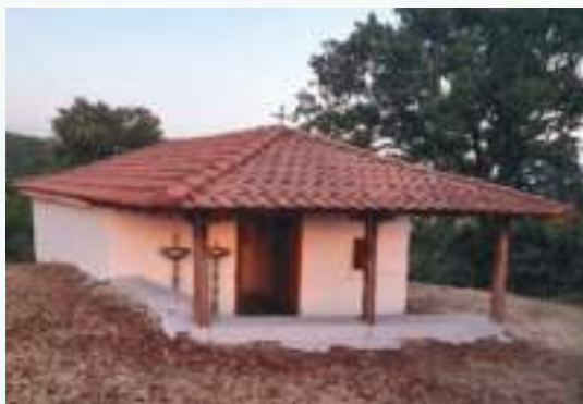
Τά ἐξωκκλήσια τοῦ Ἁγίου Γεωργίου καί τοῦ Προφήτου Ἡλίου.