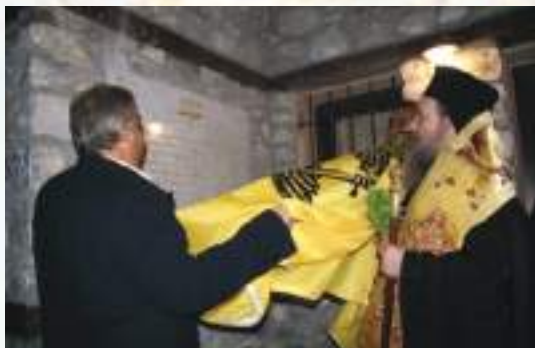
Άπό τά ἐγκαίνια τοῦ Πρεσβυτερείου.