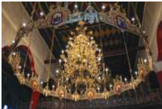
Ὁ σύγχρονος πολυέλαιος καὶ ἡ ὀροφή τοῦ Ἱεροῦ Ναοῦ τῆς Κοιμήσεως τῆς Θεοτόκου.

Παλαιότερα, τὸ ξυλόγλυπτο τέμπλο κοσμοῦσαν Βημόθυρα ἐξαιρετικῆς ὀμορφιάς, τὰ ὁποῖα ὅμως κατεστράφησαν ἀπὸ μία πυρκαϊὰ πού κατέκαψε τὸ παρεκκλήσιο τοῦ Ἁγίου Προδρόμου, ὅπου εἶχαν μεταφερθῆ.