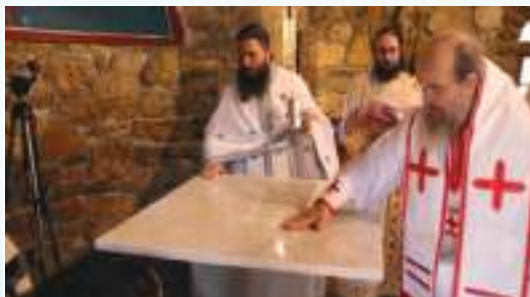
Τὰ Ἐγκαίνια τοῦ Παρεκκλησίου τῆς Ἁγίας Ἄννης.

τήν υγιειονομική εκείνη κρίση, ή ολοκλήρωση τοῦ Παρεκκλησίου καί τὰ Ἐγκαίνιά του στίς 9 Αὐγούστου 2020 ἀπετέλεσαν ἀπόδειξη τῆς πνευματικῆς προκοπῆς τῶν Ἄγιοπροδρομιτῶν καί τοῦ Ἐφημερίου τους. Τό Παρεκκλήσιο ἐορτάζει κάθε χρόνο στίς 25 Ἰουλίου καί στίς 9 Δεκεμβρίου, ἐπί τῇ μνήμῃ τῆς Κοιμήσεως καί τῆς Συλλήψεως τῆς Ἁγίας Ἄννης ἀντιστοίχως. Τό ἑσπέρας τῆς 24 ης Ἰουλίου, τελεῖται λαμπρός Ἀρχιερατικός Πανηγυρικός Ἑσπερινός καί στή συνέχεια, μαζί μέ τήν προσφορά κερασμάτων, ἀκολουθοῦν παραδοσιακές μουσικοχορευτικές ἐκδηλώσεις, δεῖγμα φιλοξενίας πρὸς τοὺς εὐλαβεῖς προσκυνητές.