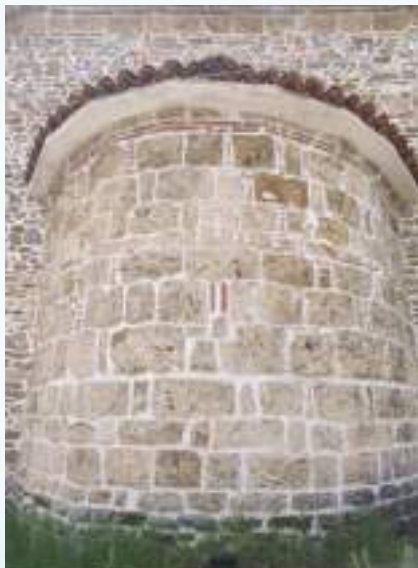
Ἡ κόγχη τοῦ Ναοῦ.