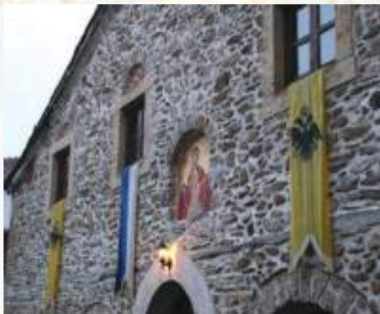
Ἡ δυτική πλευρά τοῦ Ναοῦ.

τοποθετηθῆ ἔνθετοι κεραμικοί Σταυροί καί διάφορα διακοσμητικά λιθανάγλυφα. Ὁ ἐξωτερικός διάκοσμος καί τὰ ἰδιαίτερα ἀρχιτεκτονικά του γνωρίσματα ἀνεδείχθησαν τὸ 2004, ὅταν πραγματοποιήθησαν ἐκτεταμένες ἐργασίες συντηρήσεως καί στερεώσεως τοῦ Ναοῦ.