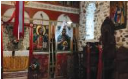
Τό ἐσωτερικό τοῦ ἐξωκκλησίου τοῦ Τιμίου Προδρόμου.

Κάθε χρόνο ἡ ἐορτή τοῦ Ἁγίου συνδυάζεται μέ τό ξακουστό πανηγύρι, πού ἤδη ἀπό τήν ὀθωμανική περίοδο εἶχε ἀποκτήσει μεγάλη φήμη, καθῶς, ὅπως σημειώνεται σέ Διοικητική