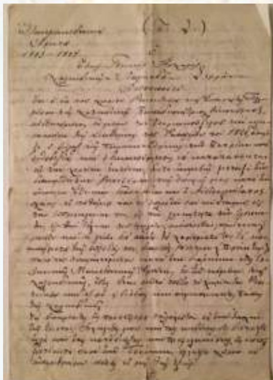
Ἐπαινετική ἐπιστολή πρὸς τόν π. Δημήτριο Οἰκονόμου γιὰ τὴν προσφορά του στὸν Μακεδο- νικό Ἄγωνα