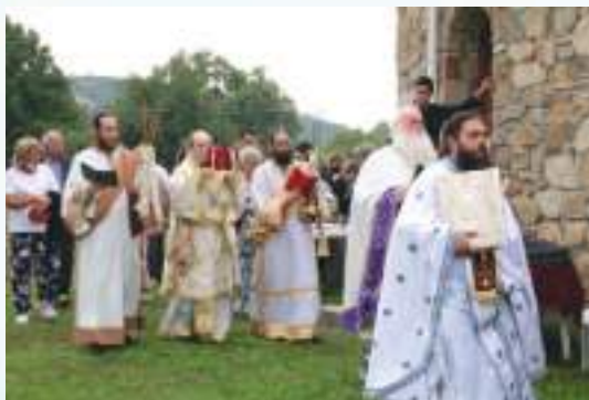
Τά Ἐγκαίνια τοῦ Παρεκκλησίου τῆς Ἁγίας Ἄννης.