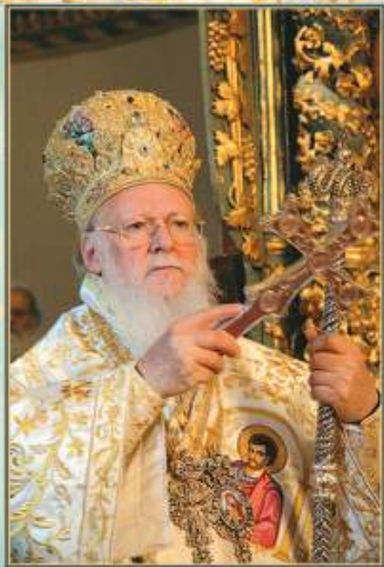
Ἡ Α.Θ.Π. ὁ Οἰκουμενικὸς Πατριάρχης κ.κ. ΒΑΡΘΟΛΟΜΑΙΟΣ